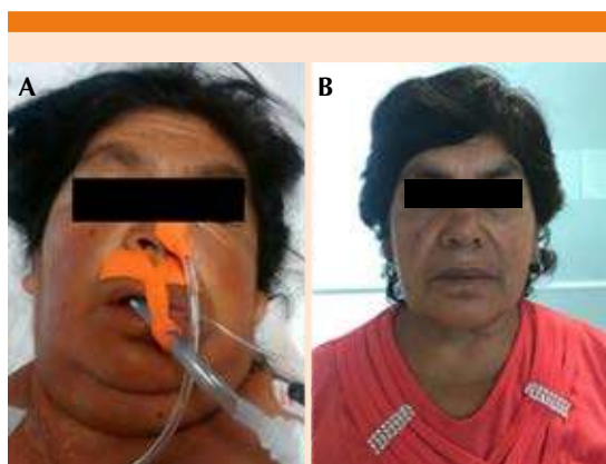
Figura 2. A. Paciente del caso número 3, en la imagen de la izquierda se observa facies mixedematosa, obesidad, cuello con circunferencia amplia. B. Mismo paciente posterior a seis meses de tratamiento con hormonas tiroideas.

Paciente femenina de 55 años de edad con antecedente de obesidad grado 3, ingresó al servicio de urgencias por padecer deterioro neurológico caracterizado por pérdida del estado de alerta con escala de coma de Glasgow de 3 puntos, se realizó intubación orotraqueal y se inició ventilación mecánica invasiva. A la exploración física se observó facies mixedematosa ( Figura 2 ), presión arterial de 90/40 mmHg, temperatura 35.4°C; se solicitó perfil tiroideo previo a iniciar levotiroxina vía enteral a dos dosis de 400 µg con diferencia de 2 horas y en estrecha vigilancia del ritmo cardiaco. El perfil