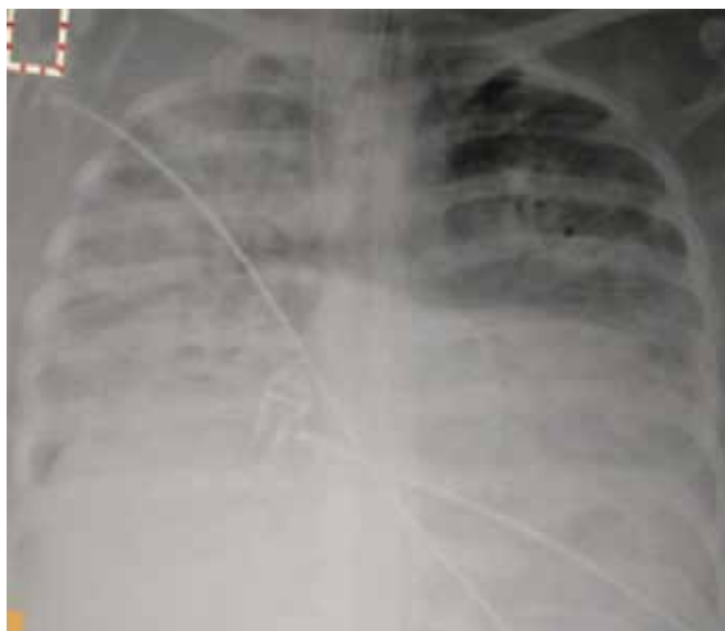
Figura 2: Radiografía de tórax portátil anteroposterior simple, que presenta opacidad alveolo intersticial bilateral, correspondiente con SDRÁ, a las 48 horas de ingreso a la UCI.

60%, PaO 2 /FiO 2 de 189 cmH 2 O, día 19 de VM con PEEP 8, FiO 2 40%, PaO 2 /FiO 2 305 cmH 2 O, retira sedación con posterior inicio de ventilación en modo CPAP presión soporte 10 cmH 2 O, PEEP 8 cmH 2 O y FiO 2 < 40%. Para el día 22 de ventilación mecánica se retira de la misma con éxito, espirometría al egreso de la unidad de obstetricia crítica, con patrón sugestivo de restricción pulmonar grave con capacidad vital forzada (FVC) de 19.5% y relación FEV1/FVC (volumen espiratorio forzado al primer segundo entre la capacidad vital) de 90.6%.