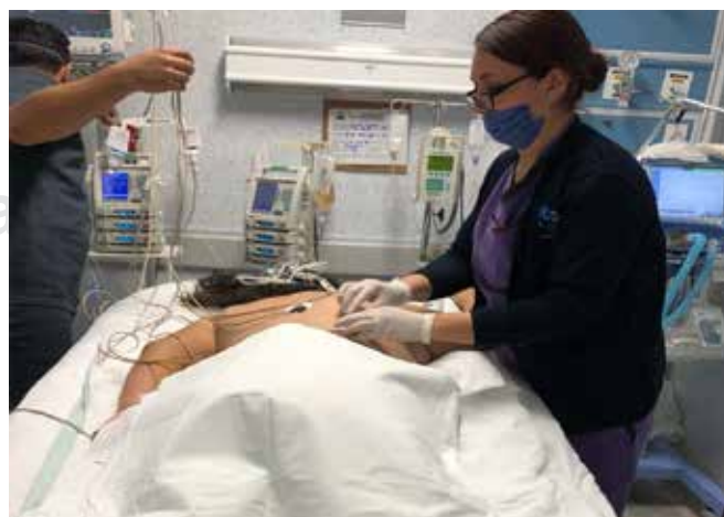
Figura 1: Paciente embarazada en posición prono.

Los siguientes cinco días presentó notoria mejoría al lograr disminuir requerimientos de PEEP y FiO_2 ; para el día 12 de VM se decide despronar con PEEP 12, FiO_2